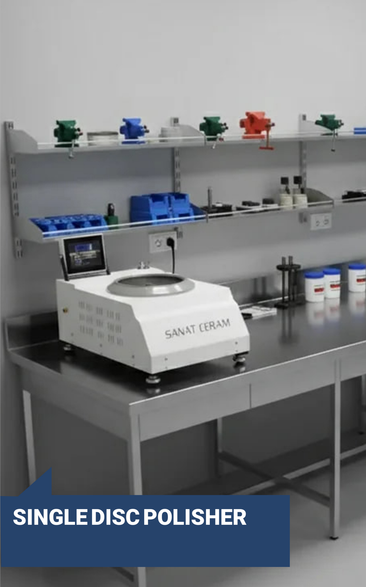
SINGLE DISC POLISHER